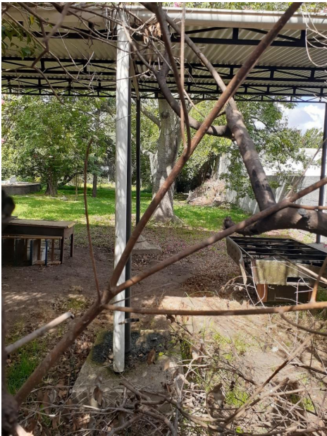
Interior del predio