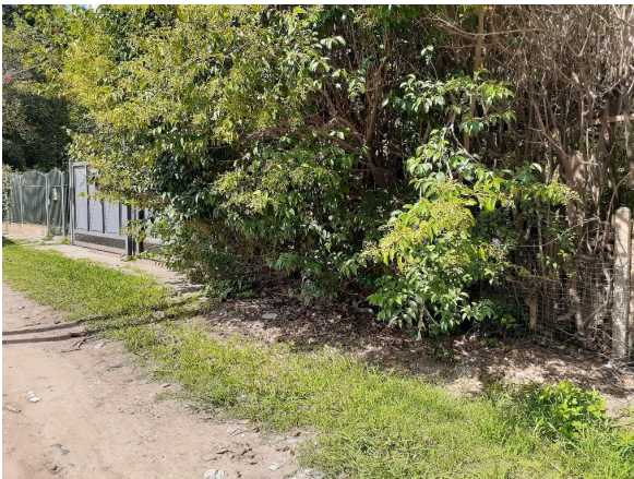
Frente del predio sobre calle Bradley