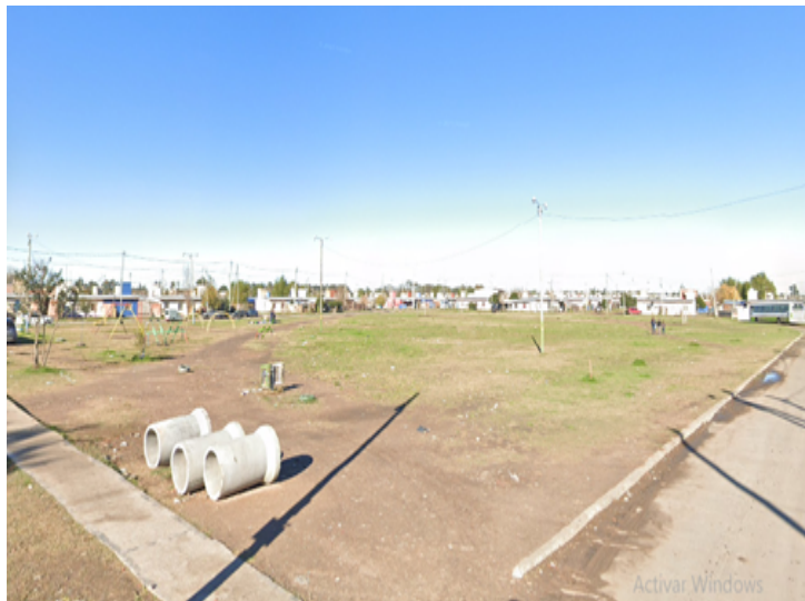
Esquina de calles 523 y 554