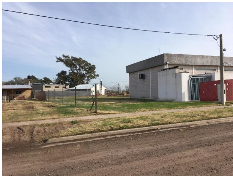
Vista del lote desde calle Tucumán, a la derecha edificio del CIC Los Sauces