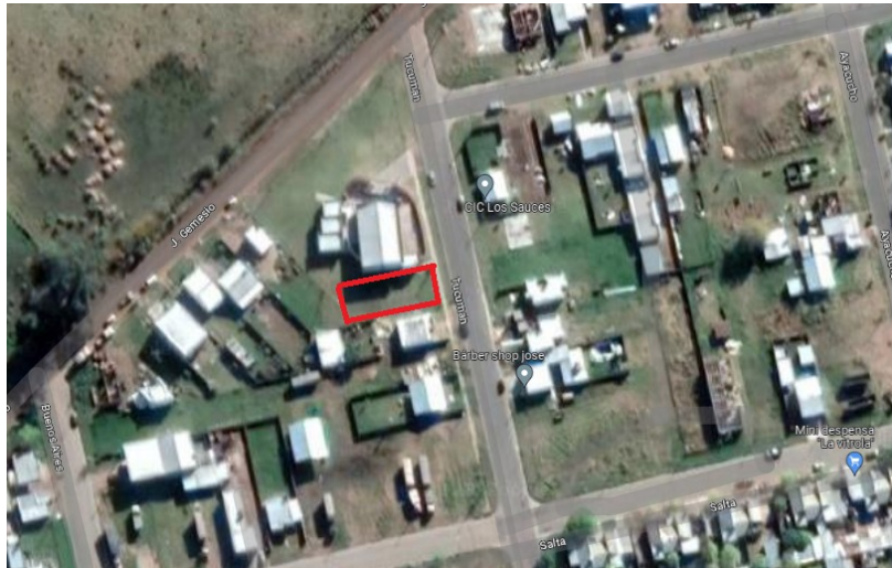
Implantación CAPS AMÉRICA - RIVADAVIA