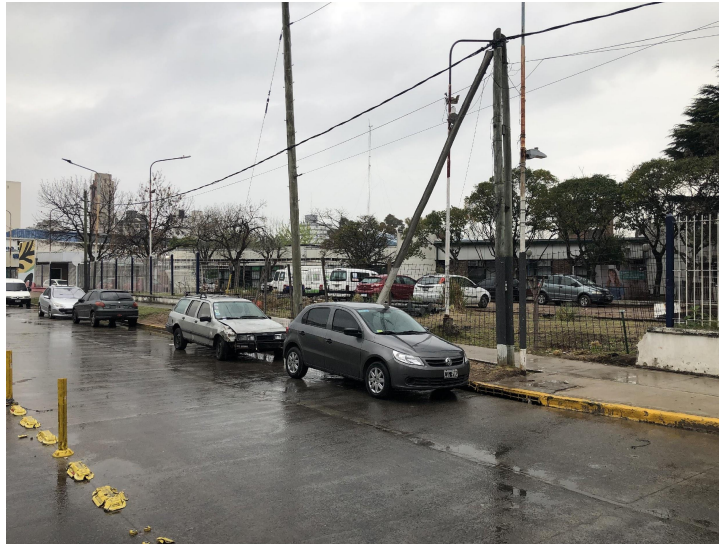
Vista del sector a intervenir desde el interior del predio (esquina de las calles Alberdi y Curapaligüe)