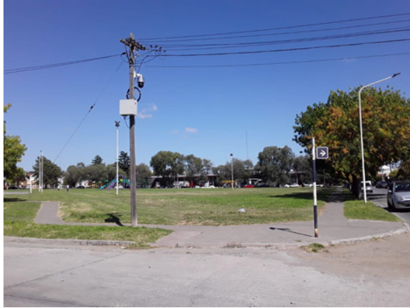
Vista desde la esquina de Italia y Venezuela