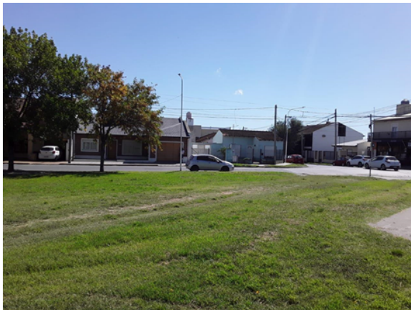
Vista hacia calle Italia