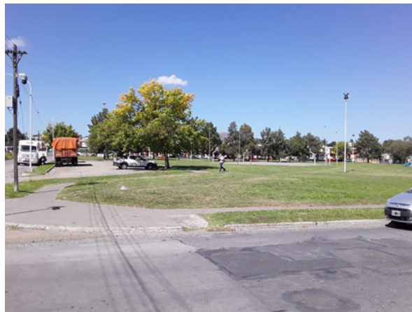
Vista desde la esquina de Italia y Venezuela