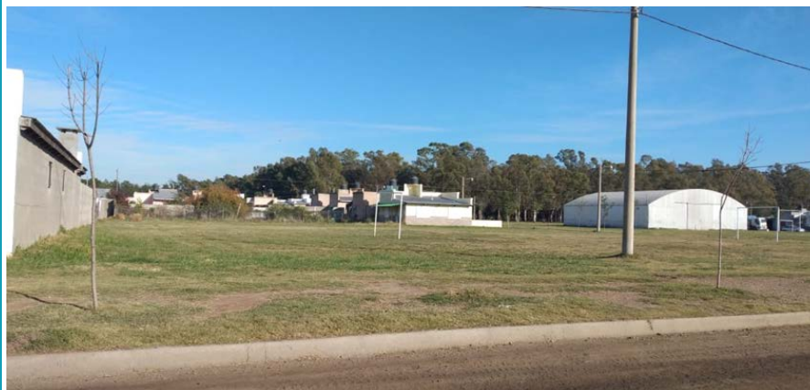
Vista desde calle Nacho Gutiérrez