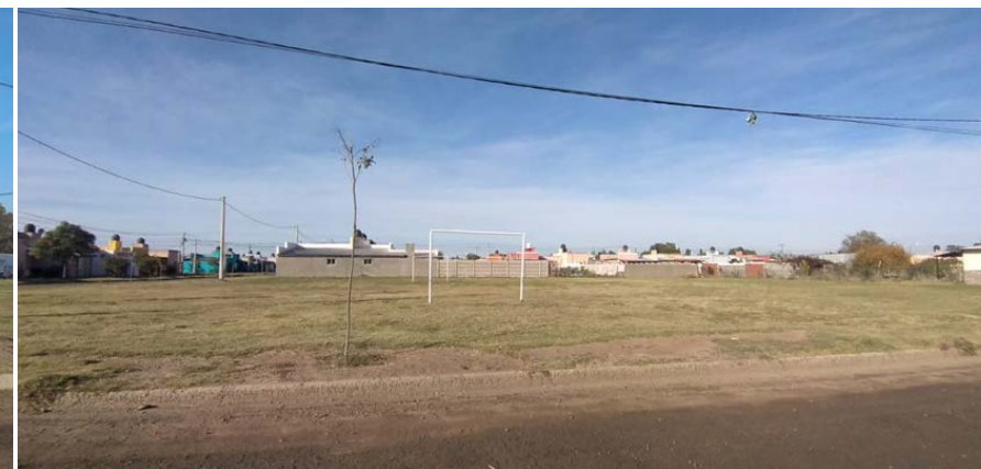
Vista desde calle Dorrego